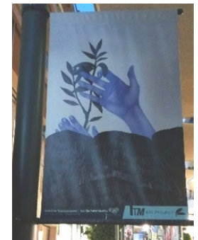
Kuvat 7-10. Larissan kaduilla moderniakin taidetta tuntui tulevan esiin melkein jokaisen kulman takaa!

Kiitokset Erasmus+ , Meri-Pohjolan opistopiiri ja Raahen opisto mahdollisuudesta syventyä taidepedagogisiin menetelmiin, pohtia taidepedagogiikkaa kansalaisopiston näkökulmasta ja verkostoitua alan toimijoiden kanssa!