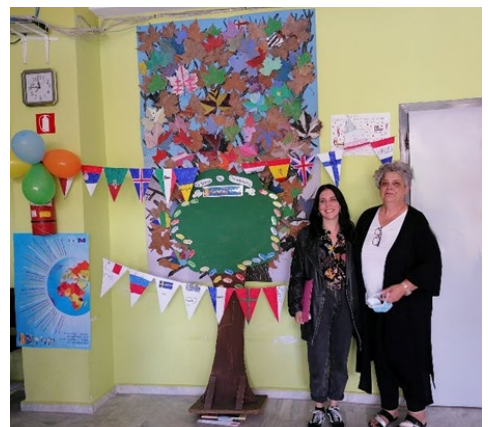
Kuva 4. Alakoulun rehtori ja taideopettaja taustalla ryhmätyö eurooppalaisten kielten viikolta.