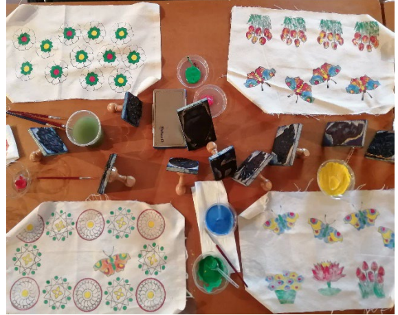
Kuva 6. Folklore Museum of Larissan kankaanpainannan työpajassa tekemämme leimasinpainantaa ja maalausta.

Hienoa antia oli myös Larissan kaupunkiin tutustuminen arkeologi Konstantina Kontsan johdolla sekä matka Meteora Monasteries'n luonnonkauniiseen vuoristoon ja uskomattomiin luostareihin. Oheisantina sain tietysti tutustua kreikkalaiseen kulttuuriin ja aimo annoksen ulkoilua, sillä liikuimme enimmäkseen jalan. Larissan kaduilla liikkuessamme ihailimme hienoja muraaleja ja parhaillaan menossa ollutta katutaideprojektia – taide ja rikas historia tuli vastaan joka askeleella. Vapaa-ajalla kävimme mielenkiintoisia keskusteluja opistotoiminnan kehittämistä ja tietysti voimaannuimme toinen toistemme seurasta!